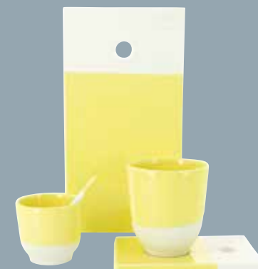
Collection Color Lab De nombreuses formes, tailles et couleurs à retrouver page 72 du catalogue général REVOL. Color Lab collection Various shapes, sizes, and colours that you can find page 72 of REVOL's general catalogue.