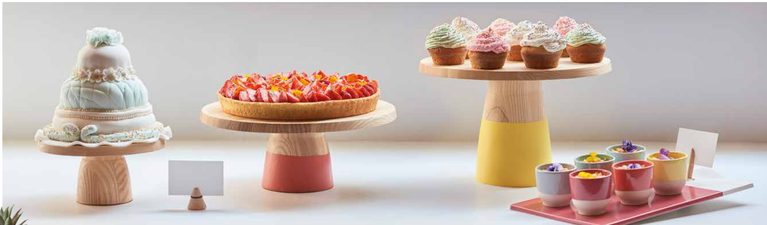
◀ Piédestal en bois de chêne décliné en 3 tailles - finition colorée ou brute. Cake stand in oak wood, offered in 3 sizes - in colour or unvarnished.