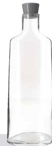
Bouteille en verre 1 L ▶ Design pensé pour faciliter la préhension et le stockage. Bouchon silicone gris-béton. Glass bottle, 1L A design conceived for better grip and storing. Concrete-grey silicone cork.