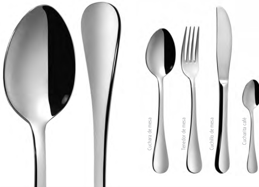
Cuchara de mesa

1: Consultar versión S en www.grupocrisol.com .