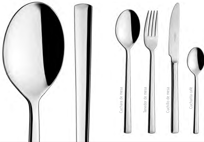
Cuchara de mesa