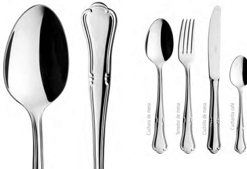
Cuchara de mesa