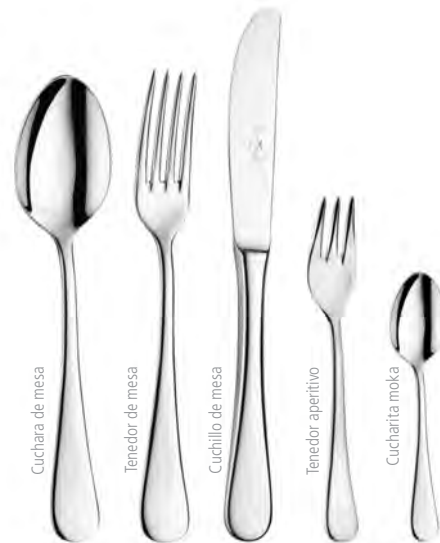
Cuchara de mesa