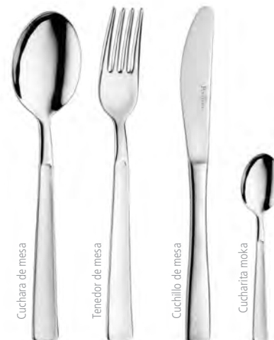
Cuchara de mesa