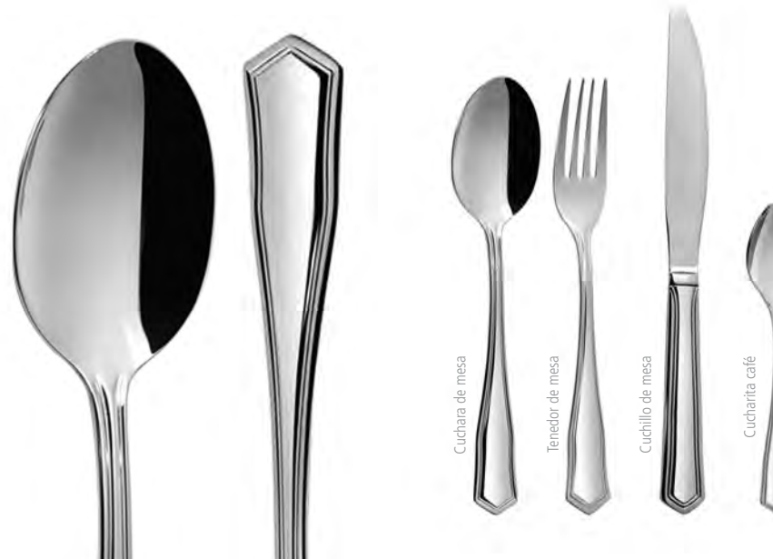
Cuchara de mesa