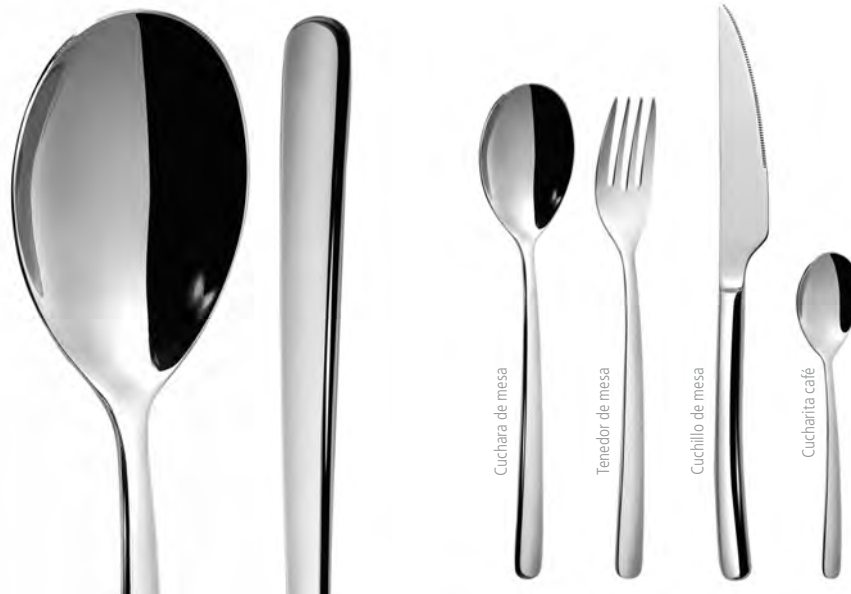
Cuchara de mesa