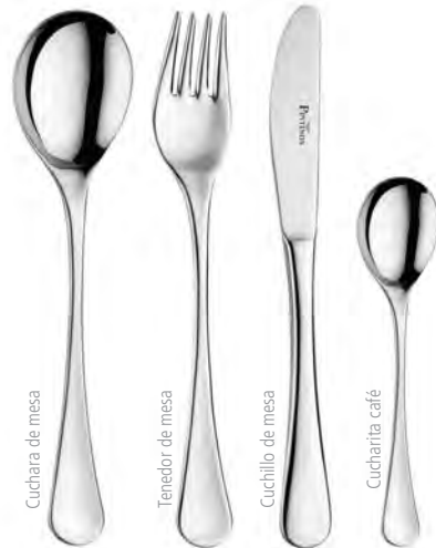
Cuchara de mesa