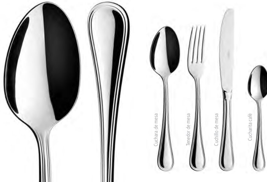
Cuchara de mesa